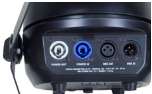
Strom- und DMX-Anschlüsse für Daisy-Chain vorgesehen

Die Anschlussbuchsen für die Stromversorgung, Stromweiterleitung sowie die DMX-Steuerung sind auf der Unterseite des Gehäuses verbaut. Die Anschlüsse sind versenkt platziert; dem ansonsten runden Gehäuse wurde hierfür eine gerade Aussparung verpasst. Bei den Anschlüssen handelt es sich um verriegelbare Power-Twist-Anschlüsse. Daneben befinden sich der DMX-Out für die Datenweiterleitung bzw. Daisy-Chain-Reihenschaltung sowie der DMX-In, beide in 3-Pin-Ausführung für die Steuerung via DMX-512.