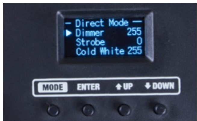
Display kontrastreich, aber leider ziemlich klein

Das OLED-Display zeichnet sich durch die kontrastreich leuchtenden Buchstaben, Zeichen und Ziffern aus. Ein im wahrsten Sinne des Wortes kleines Manko ist die etwas kleine Dimensionierung. Das macht die Ablesbarkeit – gerade im Live-Betrieb – etwas unkomfortabel. Die präzise und gut auflösende Darstellung gleicht das wiederum ein Stück weit aus. Das sicherlich auch subjektive Manko ändert nichts daran, dass die Menüführung selbsterklärend und der Menü-Baum vernünftig strukturiert aufgebaut ist. Zudem reagieren die Bedientaster einwandfrei.