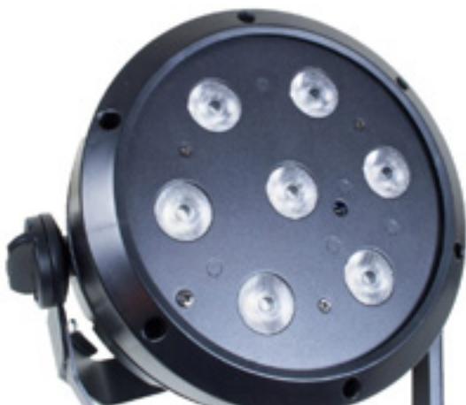
Vorderseite mit 7 x 4-Watt-LEDs

Spendiert hat Cameo seinem neuen Weißlicht-Familienmitglied sieben LEDs mit einer Einzelleistung von jeweils 4 Watt. Eingelassen sind die Leuchtmittel in eine schwarze ABS-Scheibe mit bestens ausgeführten Aussparungen. Auffällig ist die servicefreundliche und zugleich geräteschützenden Konstruktion. Bei den Schrauben des Frontpanels wurde keineswegs übertrieben. Die Schrauben der umlaufenden Einfassung der Front sind versenkt eingebracht. Wichtiges Element auf der Vorderseite ist der Sensor für den Befehlsempfang über die optionale IR-Fernbedienung.