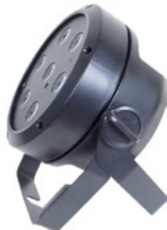
Vorbildlicher Doppelbügel mit bestem Fixiermechanismus