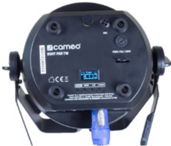
Mit Display-Bedientaster und Standfüßen sowie Stellschraube für das Uplighting und Mikrofon