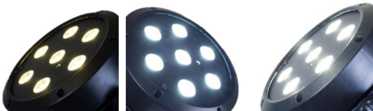
Von dezentem Warmweiß ...

Einstellen lassen die sich manuell oder per CCT in Hunderterstufen im Bereich von 3.100 bis 6.500 k. Die Resultate sind beeindruckend. Über das gesamte Spektrum hinweg erfolgen die Temperaturwechsel homogen und ohne erkennbare Brücken oder Problemzonen. Geschuldet ist diese sicht- und spürbare Effizienz auch der ebenfalls einstellbaren PWM-Frequenz, die sich wiederum mit 650 Hz, 1.530 Hz, 2.150 Hz und 4.000 Hz in vier Stufen vorwählen lässt. Die Weißlicht-LEDs erreichen laut Hersteller eine Helligkeit von 7.530 lx @ 1 m bei einem Lichtstrom von 1.380 lm.