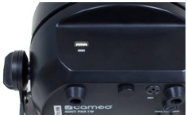
USB-Anschluss für W-DMX-Konfigurierung per iDMX-Stick

Ein weiteres besonderes Feature beherbergt die Oberseite des Gehäuses, wobei hier wie auf der Unterseite im Form-Guss eine versenkte, gerade Ebene konfektioniert wurde. Auf dieser versenkten Fläche befindet sich der USB-Anschluss. Der USB-Port dient für die Wireless-DMX-Steuerung mit dem optional erhältlichen iDMX-Stick.