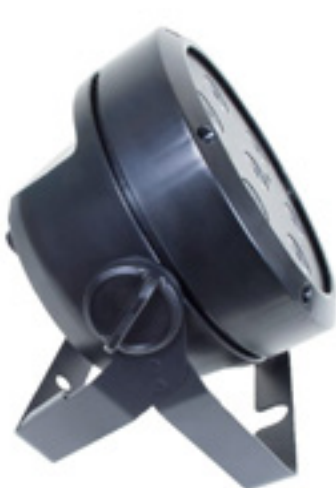
Variabel aufstellen oder hängend montieren

Je nach individuellen Anforderungen kann der Uplighting-Scheinwerfer gestellt oder alternativ am Lichtstativ oder der Traverse montiert werden. Ausgestattet ist er dafür mit einem Doppel-Montagebügel, der sich als wirklich vorbildlich erweist. Zunächst ist er ausreichend groß dimensioniert, zudem lässt er sich bestens verstellen, bedienen und fixieren. Das hat einfach Hand und Fuß; die Elemente des Fixiermechanismus greifen vernünftig ineinander. Um die Schrauben zu kontern, wird keinerlei Kraft benötigt, außerdem liegt der Griff optimal in der Hand.