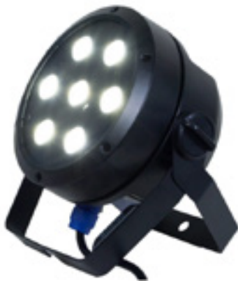
Weißlicht-LED-PAR-Scheinwerfer mit regelbarer Farbtemperatur: Cameo Root Par TW

Der Cameo Root Par TW überzeugt als echte Bereicherung für kleine bis mittelgroße Veranstaltungen. Zunächst punktet er mit qualitativer Fertigung, bei der keine Fragen offenbleiben. Dann zeigt er sich mit durchdachter Ausstattung und Menüführung, ebenso den flexiblen Steuerungsvarianten. Angesichts der Lichtleistung, der hochwertigen Lichtqualität, außerdem den schnell wechselbaren Lichttemperaturen und der professionellen Menüstruktur ist vor allem eines beeindruckend: der angesichts seiner Matchwinner-Qualitäten für spezielle Anwendungen günstige Preis. Vermutlich hätte so mancher andere Anbieter da markant tiefer in die Verbraucher- und Anwendertasche gegriffen. Der Root Par TW von Cameo macht Spaß und hat sich eine anerkennende Kaufempfehlung mehr als verdient.